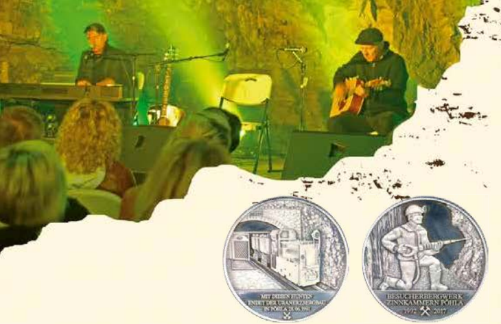
Jubiläumsmedaillen in Kaiserzinn und Silber erhältlich!